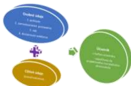
Modelová situácia 2